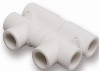
Распределительный узел D 20, 25 мм